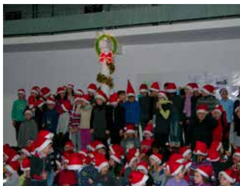
Les enfants du Père Noël Chants de Noël à la salle omnisports de Nuaillé du 14 décembre 2012