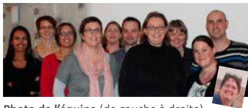
Photo de l'équipe (de gauche à droite)