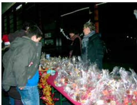
Délices et féérie Marché de Noël du 14 décembre 2012 A l'école publique de la Vallonnerie