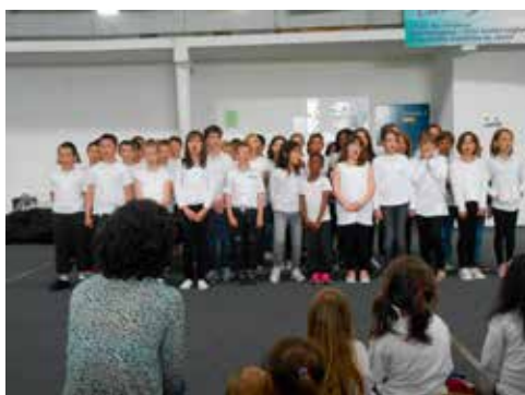
La fête de l'école le 22 juin 2013... spectacle des enfants...