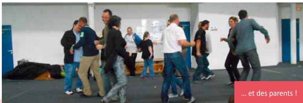
... et des parents !