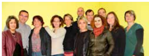
Photo de l'équipe (de gauche à droite)

Boîte e-mail de l'APEL : apel.nuaille.angegardien@ec49.net