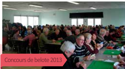
Concours de belote 2013