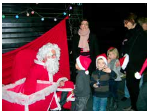
La magie du père Noël... pour les petits comme les plus grands