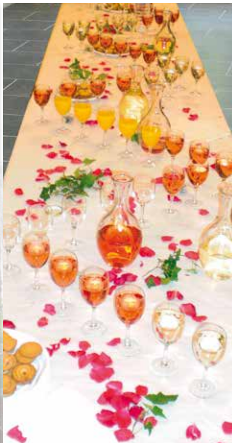
Un vin d'honneur sera servi à l'issue de la cérémonie

Cependant, comme les années précédentes, il offrira ses Voeux aux habitants de Nuaille le vendredi 17 janvier Salle de la Vallonnerie à 18h30