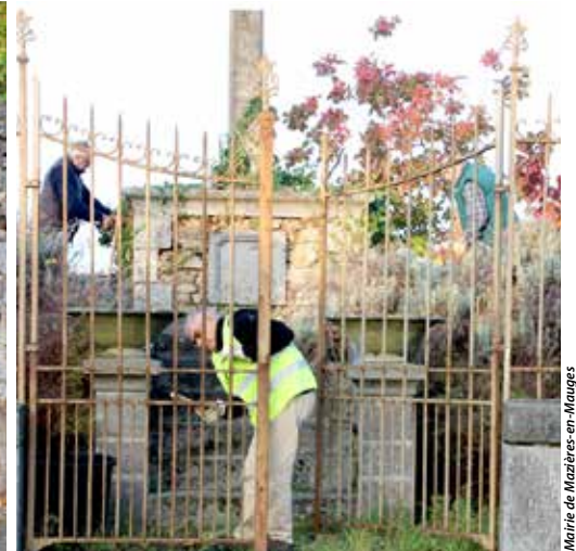
Mairie de Mazières-en-Mauges