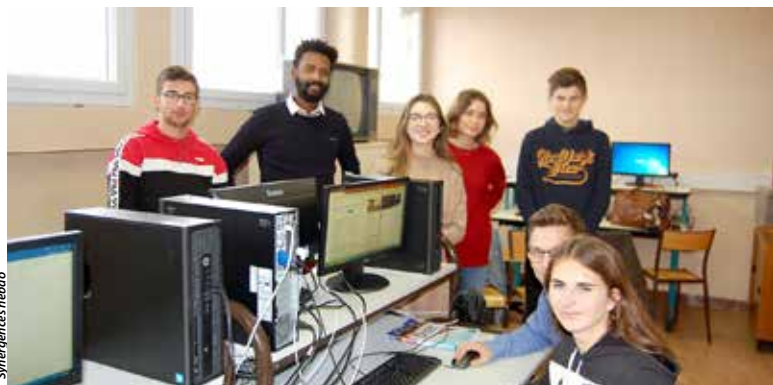
L'un des groupes travaillant sur la problématique de Marques Avenue.

Les élèves de BTS et de Bac pro commerce du lycée Europe participent à un concours les amenant à collaborer avec quatre centres commerciaux choletais. Ils seront sur site fin février pour mettre en place leurs actions.