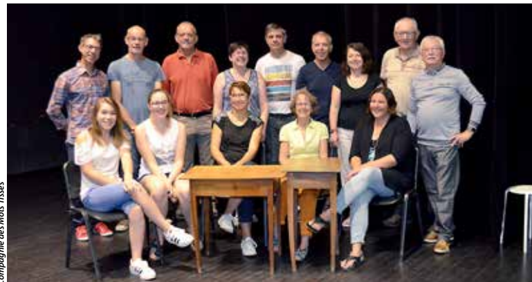
Compagnie des Mots Tissés

À l'occasion des dix ans de Tessallis, la Compagnie des Mots Tissés présente son nouveau spectacle.