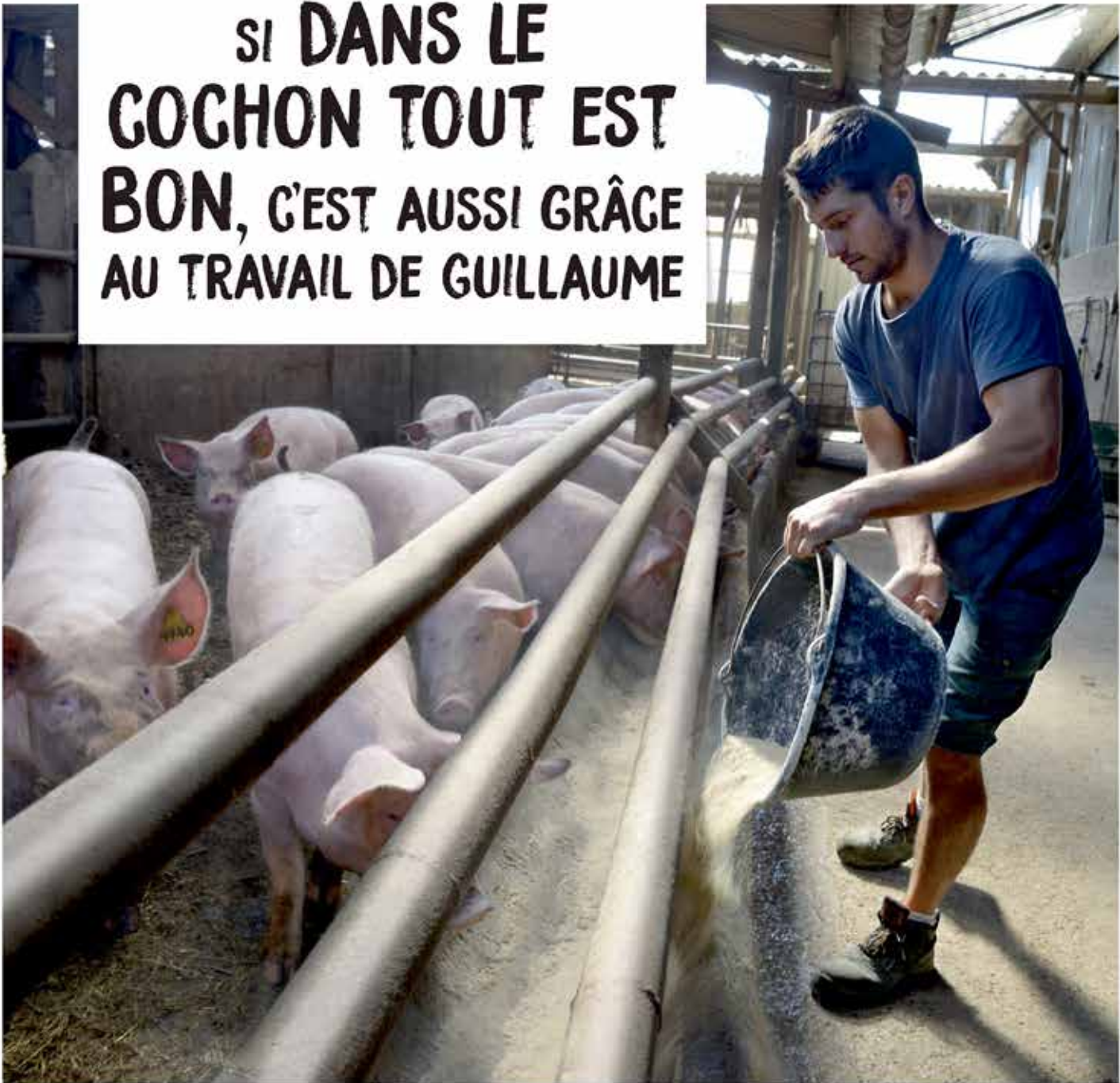
Direction de la Communication - Ville de Cholet / AGC - photo : M. RICHARD - septembre 2018

SI DANS LE COCHON TOUT EST BON, C'EST AUSSI GRÂCE AU TRAVAIL DE GUILLAUME