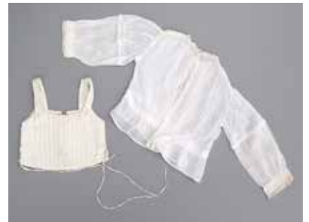
Corset de fillette - Début du XX e siècle - N°inv. 2003.080.14 - Collection du Musée du Textile et de la Mode

Dans un coin des musées, un objet attire l'œil... Découvrons-le!