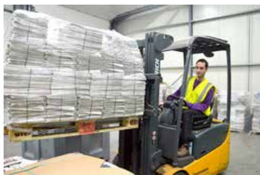
Réception sur le site Adrexo, zone d'activités de La Bergerie à La Séguinière.