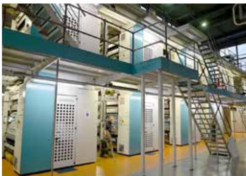
Salle des rotatives : les 51 100 exemplaires sont imprimés en 50 minutes.