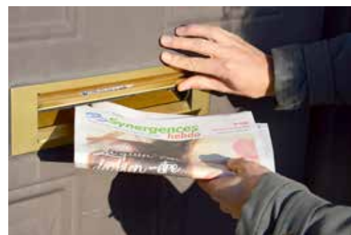
Du lundi au jeudi, 54 porteurs assurent la distribution dans votre boîte aux lettres.