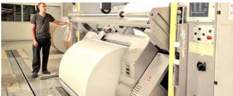
Mise en place des bobines.