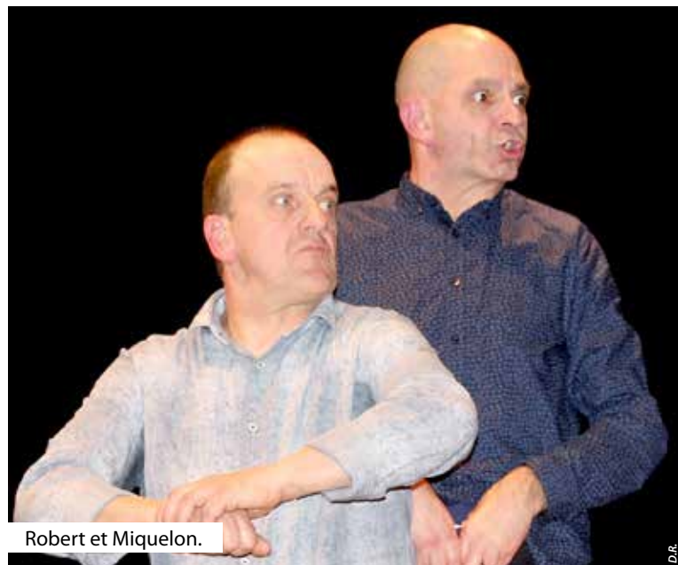
Robert et Miquelon.

Pour venir applaudir Robert et Miquelon une toute dernière fois, il ne faut pas manquer leurs ultimes représentations, du vendredi 7 au dimanche 9 décembre.