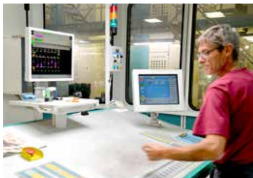
Salle des pupitres : où est contrôlée la qualité d'impression.