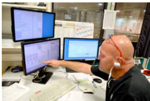
Salle de contrôle des rotatives et de l'assemblage du journal.