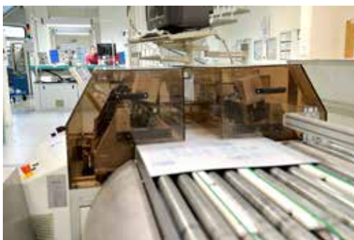
Réalisation des plaques photosensibles servant à l'impression.