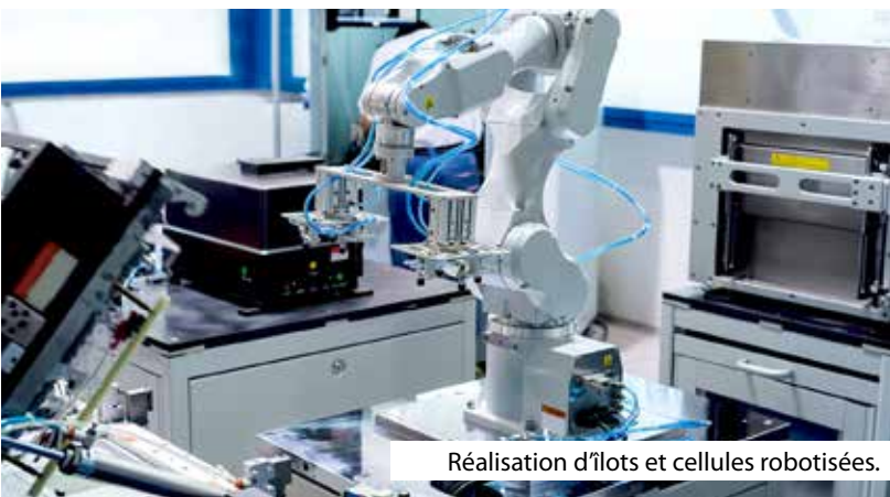
Réalisation d'îlots et cellules robotisées.