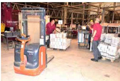
Conditionnement et expédition.