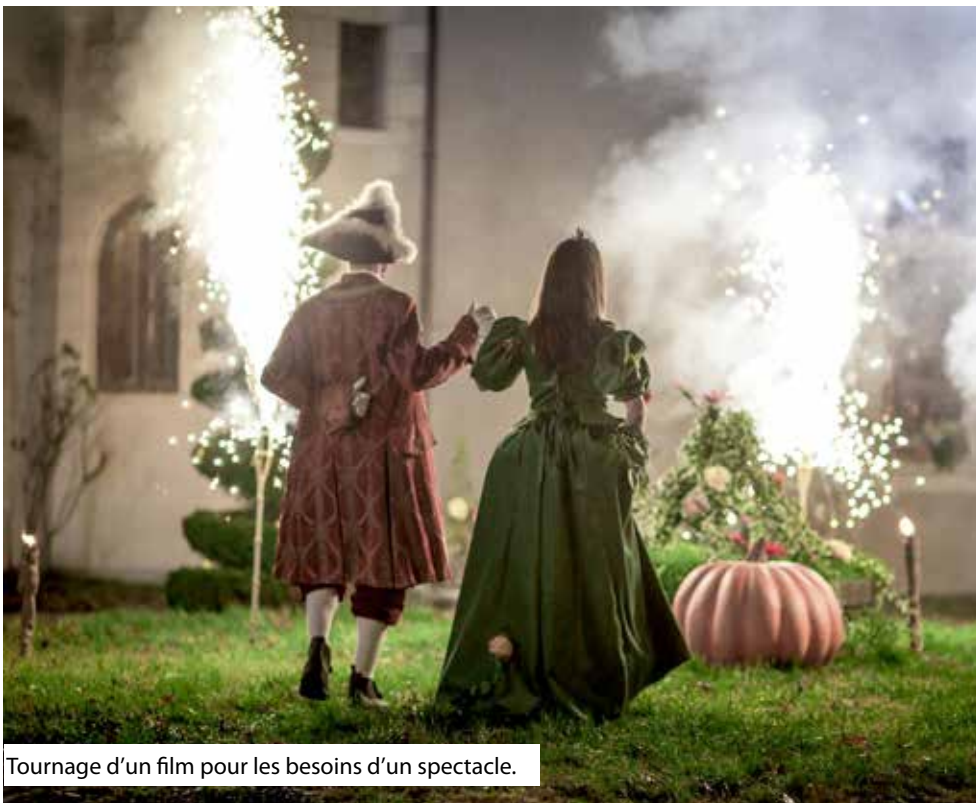
Tournage d'un film pour les besoins d'un spectacle.

L'expertise du monde industriel permet à la société de garantir les meilleures solutions pour optimiser les coûts d'investissement et de fonctionnement.