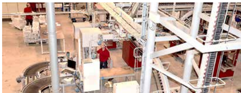
Assemblage des pages et mise en paquets.