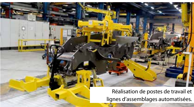
Réalisation de postes de travail et lignes d'assemblages automatisées.